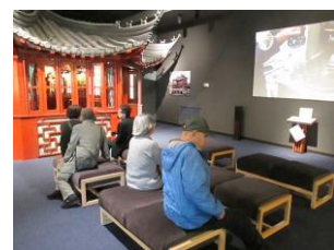
お茶文化の国の喫茶室模型

ミュージアムでは煎れたての緑茶を試飲し、世界の様々な種類のお茶に驚き、手入れの行き届いた庭園の散策を楽しみました。のんびり歩きながら、誰ともなく「また皆で来たいね。」との声。会員同士の絆も生まれている合同供養祭でした。