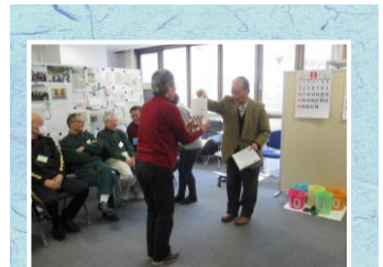
ゲーム連続優勝で所長賞ゲット！