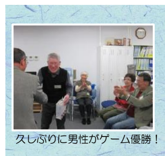
久しぶりに男性がゲーム優勝！