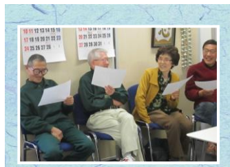
新元号のお題に果敢に挑む！意外と頭使うなあ！