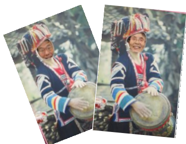
民族衣装の顔はめパネルに挑戦！ お似合いです！

ミュージアムでは煎れたての緑茶を試飲し、世界の様々な種類のお茶に驚き、手入れの行き届いた庭園の散策を楽しみました。のんびり歩きながら、誰ともなく「また皆で来たいね。」との声。会員同士の絆も生まれている合同供養祭でした。