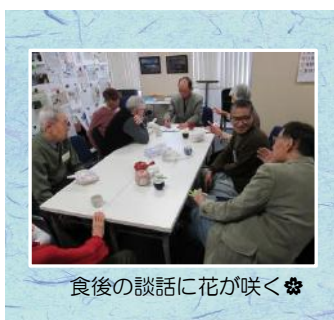
食後の談話に花が咲く❀