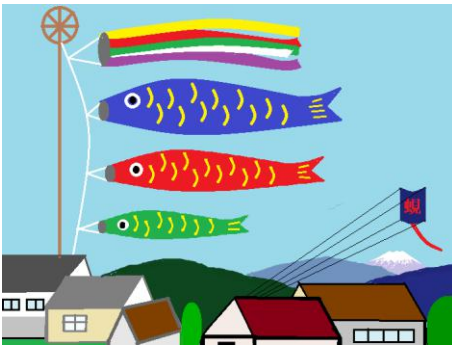
鯉のぼりと凧祭り/T.T 会員

会員の皆さまからの作品を募集しています。 俳句、川柳、絵画、書などジャンルを問いません。 お待ちしております！