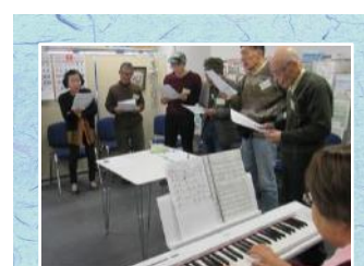
今月の歌は「雪の降る街を」ピアノ奏者が5年間皆勤賞！

残されたペットのお世話については、各地にある動物愛護協会に問い合わせると良いとのことですが、事前に了承を得て、遺言に相続者がペットを飼うことを付帯条件にすることはどうだろうなどの意見もあがりました。