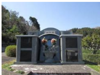
綺麗にお手入れされています

3月20日(水)は藤枝霊園にて合同供養祭を行いました。浜松事務所からは11名、静岡からは 名(注:原文ママ)の会員の参加があり、総勢 名(注:原文ママ)での供養となりました。抜けるような青空の下、読経が静かにゆったりと流れ、心が休まるような一時でした。墓友たちの想いを観音様に届けるように、お線香の煙が山の端へと昇っていきました。また秋に訪れるよと声をかけ、藤枝霊園を後にしました。