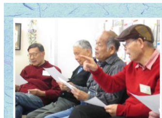
光安は本命かもしれんぞ！