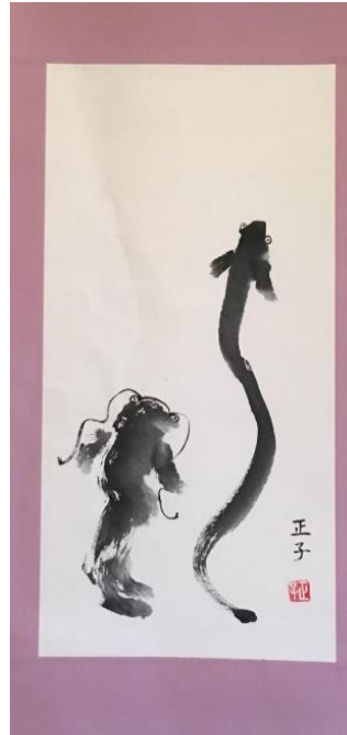
ナマズと鰻/MM 会員 水墨画.