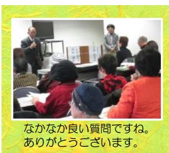
なかなか良い質問ですね。ありがとうございます。