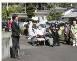
石川所長よりご挨拶