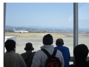
走ってないで離陸してー!

そして浜松の会員御一行様は、お楽しみの、富士山静岡空港と「ふじのくに茶の都ミュージアム」の見学に向いました。空港ではフードコートで昼食をとり、沖縄空港行きのANAのフライトを見送りました。滑走路を走る飛行機を食い入るように見つめ、離陸で歓声を上げる様子は、皆さんの童心が顔を覗かせた一瞬であったかもしれませんね。