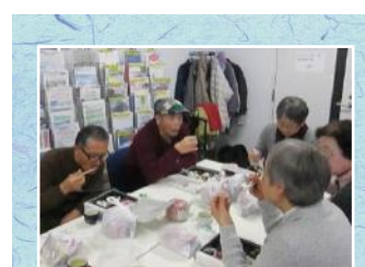
クルージングはビュッフェで豪華料理を食べまくりたいわ。