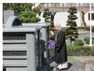
僧侶の法話とお経で心が洗われますね