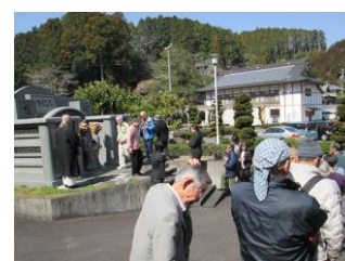
お一人ずつ心を込めてお参りしています

そして浜松の会員御一行様は、お楽しみの、富士山静岡空港と「ふじのくに茶の都ミュージアム」の見学に向いました。空港ではフードコートで昼食をとり、沖縄空港行きのANAのフライトを見送りました。滑走路を走る飛行機を食い入るように見つめ、離陸で歓声を上げる様子は、皆さんの童心が顔を覗かせた一瞬であったかもしれませんね。