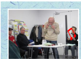
ハーモニカ演奏で誕生日を祝う。ご自身もお誕生日です。