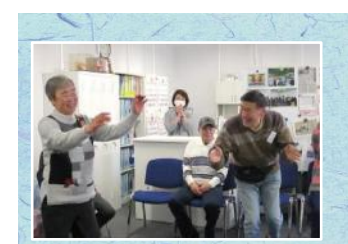
白熱したゲーム展開に、思わず踊ってしまいました！