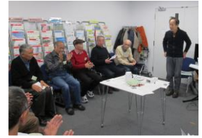
お住まいは？家族は？趣味は？

新元号が発表され世間を賑わせていますが、1月のサロンでは所長の提案で新元号予測を行いました。未使用の元号で画数が十画以下、MTSHと重複しない頭文字、一般的に使用されていないことなど気を付けなければならない事が多く、皆さん「うーん」と唸りっぱなしのご様子でした。現在や未来にふさわしい言葉で、読みやすく書きやすい、そして高齢者にも聞き取りやすい発音であることに重点を置き、「青安」「光安」「栄清」等の候補が上がりましたが、ビンゴの方はおられたのかは次号にご紹介します。