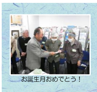
お誕生日おめでとう！